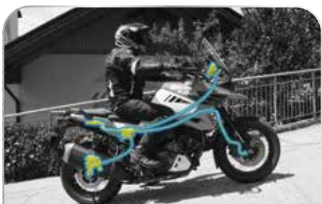
斜坡起步輔助系統

SUZUKI 智慧騎乘系統 (SUZUKI Intelligent Ride System, S.I.R.S) 包括能在煞車方面給予輔助的動態追蹤ABS系統、斜坡起步輔助系統、陡坡緩降輔助系統與負載煞車控制系統，以及增添騎乘便利性的定速巡航系統、SUZUKI動力模式選擇系統(SUZUKI Drive Mode Selector, S.D.M.S)和循跡防滑系統，讓V-Strom 1050XT成為智慧的冒險大師。