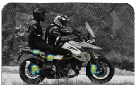
負載煞車控制系統

當騎乘於陡坡時，系統會自動調控煞車力道，使得前後制動力平均分配，避免車輛向前翻覆的情形發生。