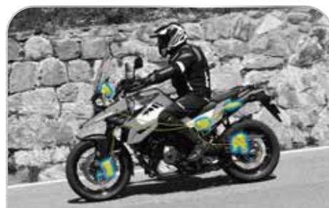
陡坡緩降輔助系統

當面臨斜坡起步時，系統將自動控制後煞車，防止車輛向後滑動，協助您達成順暢的上坡起步。